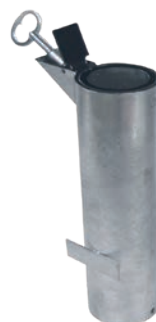
Réf. 204294 Ø 76 mm