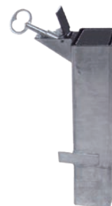
Réf. 204295 70 x 70 mm